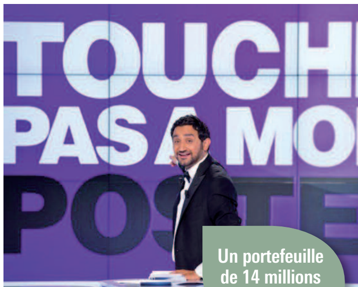
CYRIL HANOUNA, ÉLU MEILLEUR ANIMATEUR EX-AEQUO 2013, ANIME TOUS LES SOIRS «TOUCHE PAS À MON POSTE»

Au premier semestre, Groupe Canal+ a signé plusieurs accords pour renforcer son offre d'émissions de sport (acquisitions des droits exclusifs de la Premier League anglaise et du Championnat du Monde de Formule 1), de séries et de documentaires (accord