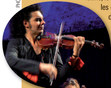
NEMANJA RADULOVIC AU FESTIVAL DE LA VÉZÈRE

DON GIOVANNI AU FESTIVAL D'AIX-EN-PROVENCE